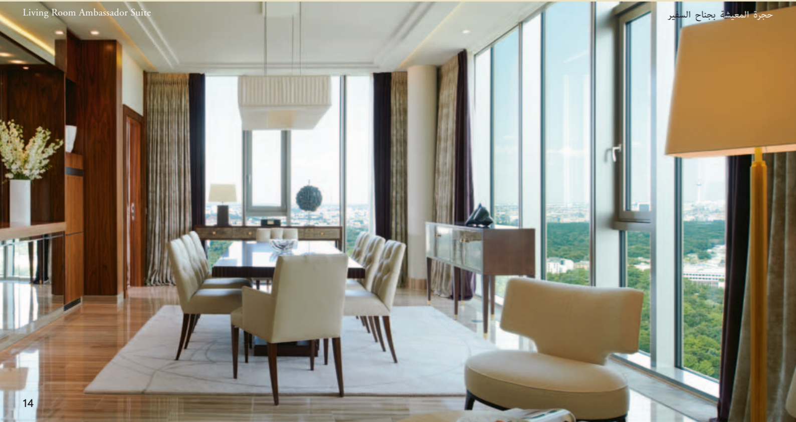
Living Room Ambassador Suite