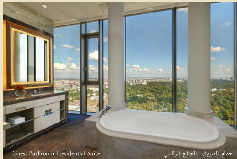
Guest Bathroom Presidential Suite