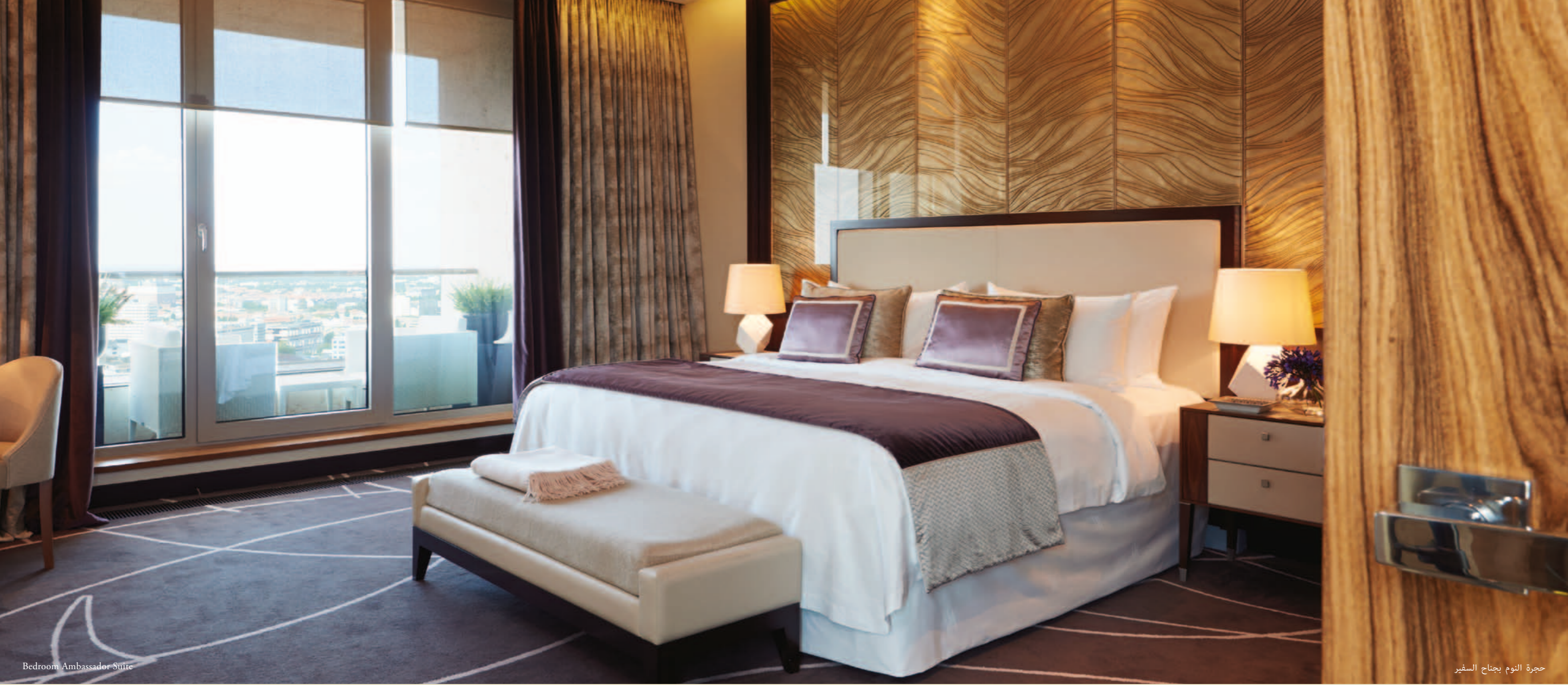
Bedroom Ambassador Suite