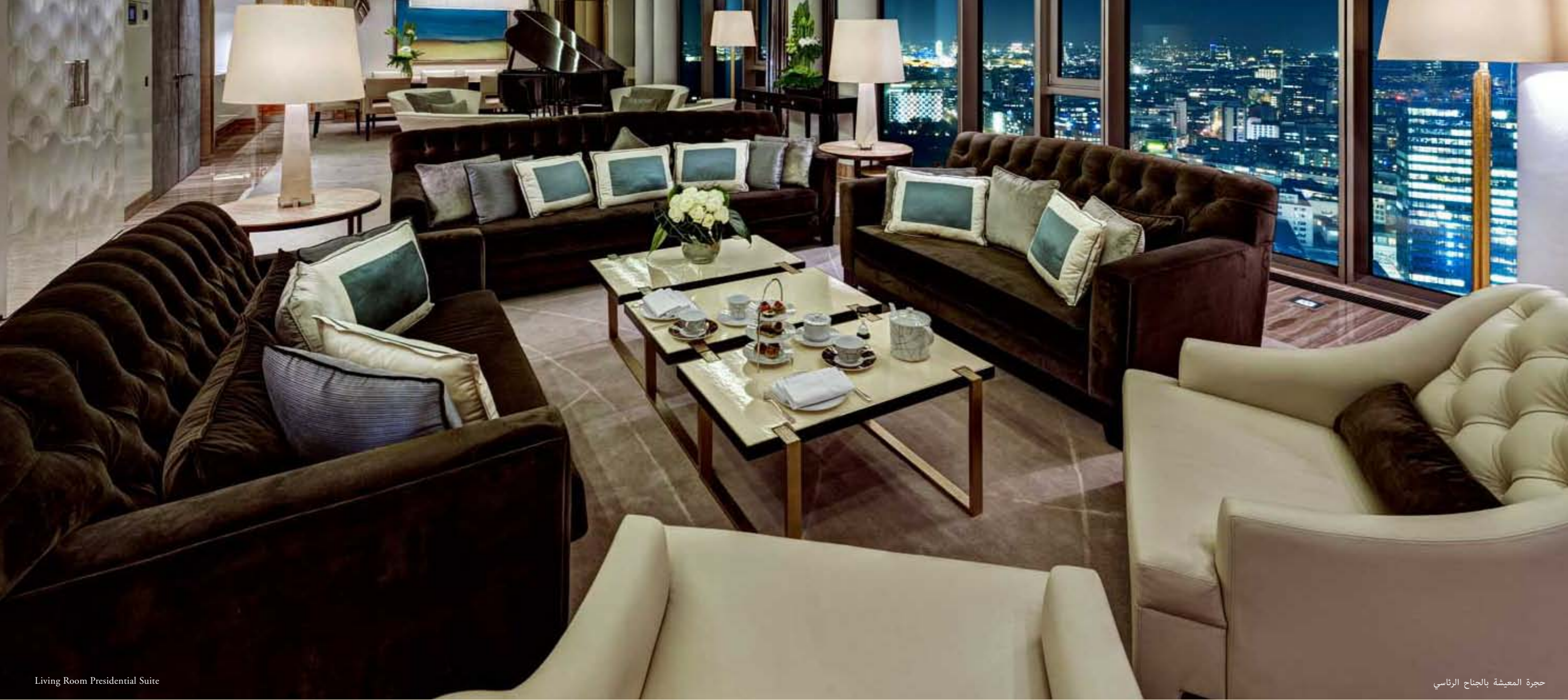
Living Room Presidential Suite