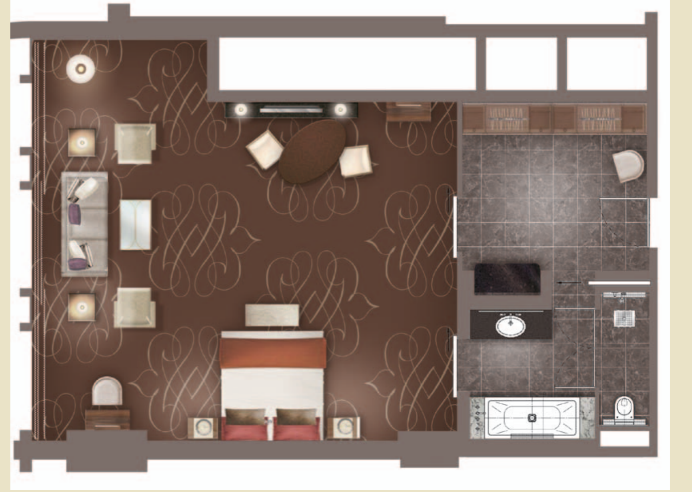
مخطط الجناح الصغير