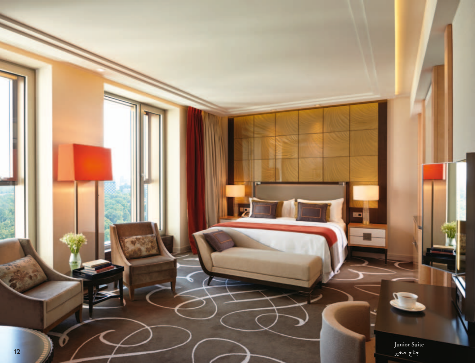
Junior Suite جناح صغير