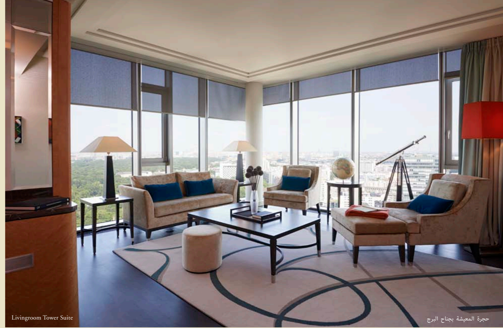
Livingroom Tower Suite

٥٠ جناح صغير توفر محيط أنيق ومريح على مساحة ٦١ متر مربع (٦٥٦ قدم مربع). توجد الأجنحة في الطوابق ٣-١٤، وتتميز بوجود غرفة نوم وغرفة معيشة بها شيزلونج أنيق، منضدة تزيين، وطاولة طعام لشخصين، تتيح لك الاستمتاع بأجود المأكولات بخصوصية في حجرتك الخاصة. تستحضر العناصر الديكورية صخب عشرينيات القرن العشرين: أمطاط الخطوط الفرنسية على السجادة، وزخارف الأوراق الذهبية على رأس السرير والأضواء المتغيرة حسب المزاج في الحمام الرخامي.