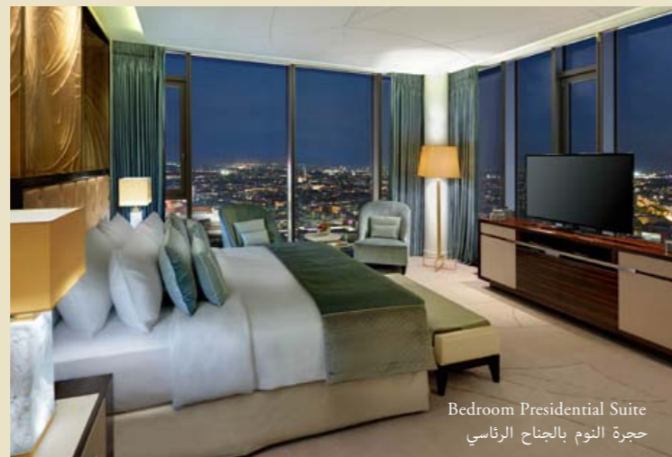
Bedroom Presidential Suite حجرة النوم بالجنح الرئاسي