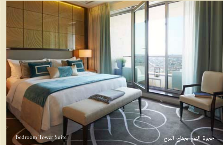
Bedroom Tower Suite