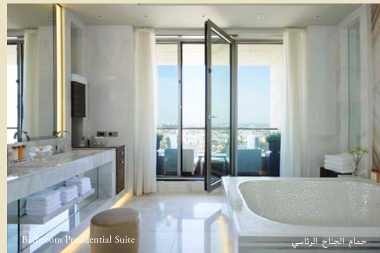
Bathroom Presidential Suite