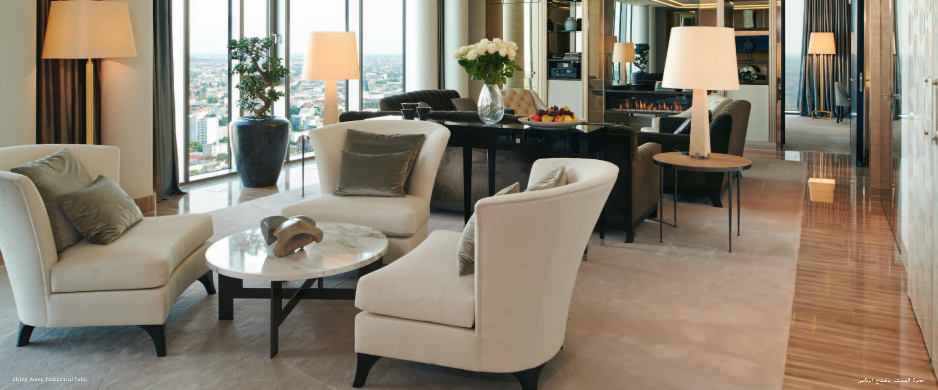
Living Room Presidential Suite