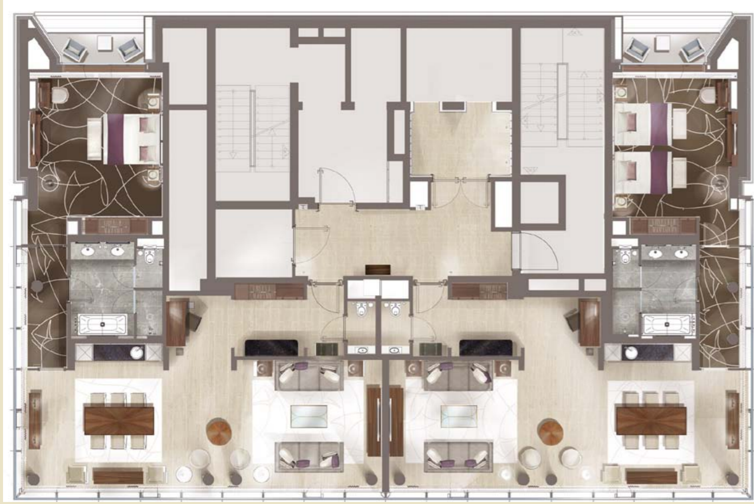
مخطط أجنحة السفير (الشمالي والجنوبي)