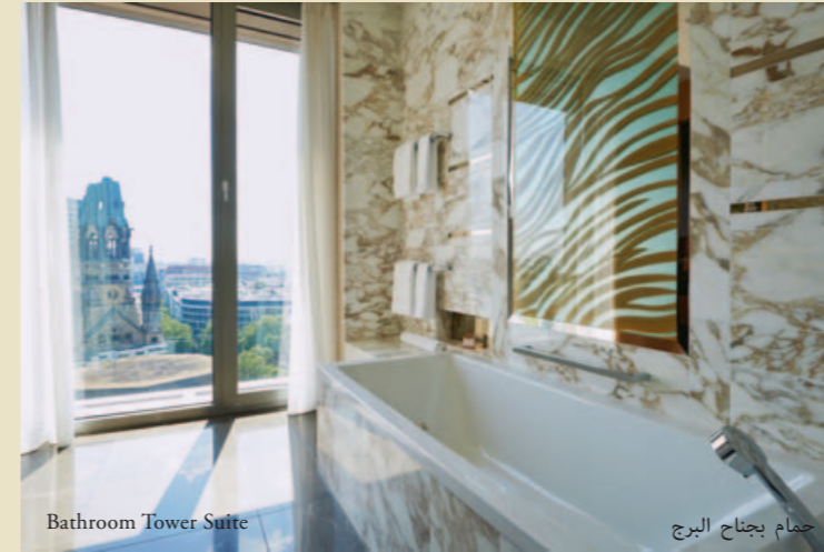
Bathroom Tower Suite